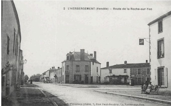
2 L'HERBERGEMENT (Vendée) – Route de la Roche-sur-Yon

Ne manquez pas ce rendez-vous pour en apprendre plus sur l'histoire de la commune !